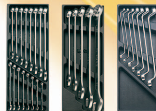
T15 T16 T40